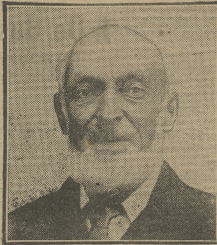
Den Heer TRIM (volgzaam foto)

Verzorgd werk en spoedige bediening aan voordeelige voorwaarden.